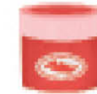
pahar de apă